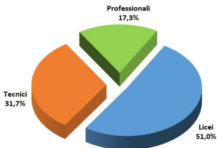
Graf. 3 - Alunni delle scuole secondarie di II grado per percorso di studio_ A.S. 2021/2022